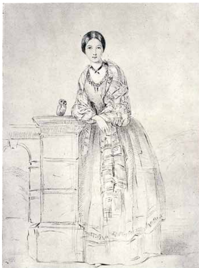
Melle Nightingale et sa chouette apprivoisée, Athéna, vers 1850, d'après un croquis de Parthenope, Lady Verney.

Enfin, Florence Nightingale préconiserait une approche intergénérationnelle, dans laquelle des dirigeants jeunes et plus âgés seraient formés ensemble aux méthodes d'organisation et aux compétences d'influence politique. Ensemble, ces cheffes de file, nouvelle génération de Nightingales, mèneraient la charge en faveur des soins infirmiers conçus comme un mouvement mondial pour le bien social.