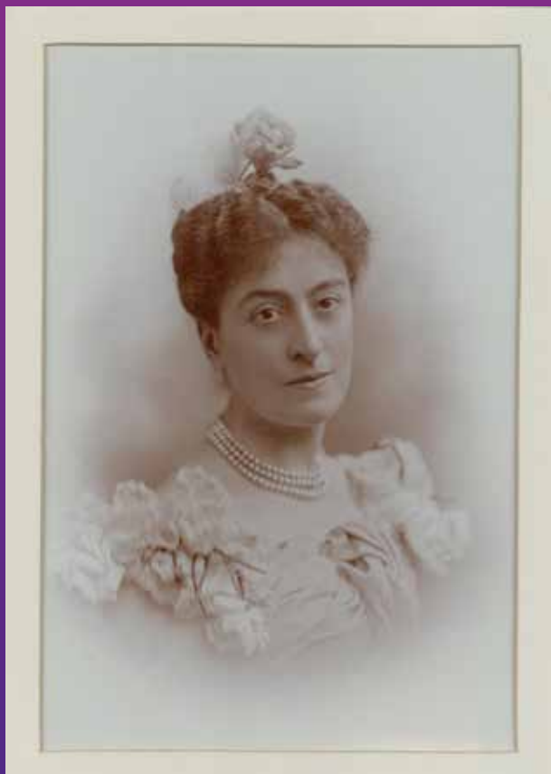
Mme Ethel Gordon Bedford Fenwick, du Royaume-Uni, Présidente du Conseil international des infirmières, 1900-1904.

« La profession infirmière, surtout à l'heure actuelle, a besoin d'être organisée ; les infirmières, surtout à l'heure actuelle, ont besoin d'être unies. L'importance du travail des infirmières auprès des malades est désormais reconnue par le gouvernement de ce pays et par ceux de tous les autres pays civilisés. Mais il dépend des infirmières, individuellement et collectivement, de rendre leur travail le plus utile possible aux malades. Or, cela ne pourra se faire que si la formation des infirmières repose sur des principes si étendus que l'expression « infirmière formée » désigne une personne ayant reçu une formation efficace et se soit montrée suffisamment digne de confiance pour que ses responsabilités puissent être exercées au plus grand bénéfice des personnes confiées à sa charge. À cet égard, il est nécessaire de disposer, d'une part, de systèmes reconnus de formation des infirmières et, d'autre part, de mécanismes de contrôle de la profession infirmière. L'expérience montre que ces résultats seront impossibles à atteindre par une profession désunie dans ses demandes de réforme ; seule l'union nous permettra de rassembler les forces nécessaires à cet égard 10, p.7. »