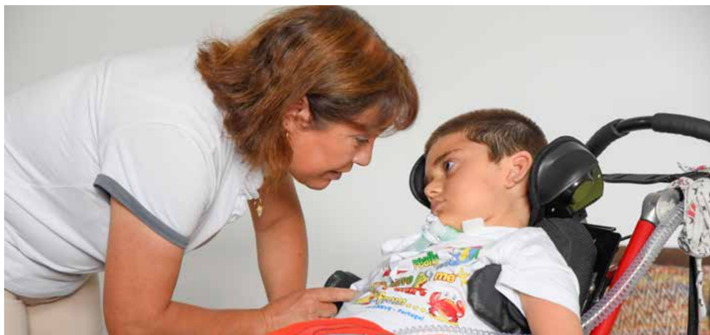
Kastelo est la première unité de soins palliatifs pour enfants dans la péninsule ibérique. Une équipe d'infirmières et de pédiatres y prend en charge jusqu'à trente enfants atteints de maladies chroniques.

Paradoxalement, les services de prise en charge des personnes qui approchent de la fin de leur vie sont sous-utilisés, même dans les pays où les ressources et les preuves de l'efficacité des soins palliatifs existent. Certains auteurs 44 pointent le risque de surmédicalisation des soins palliatifs et donc de perte de leur dimension holistique essentielle ; ce processus serait à l'œuvre en particulier dans les pays riches, où dominent encore les processus biomédicaux. Les infirmières jouent un rôle de sensibilisation important pour prévenir cette tendance et pour faire en sorte que les progrès scientifiques qui sous-tendent les interventions palliatives restent orientés sur les besoins et les souhaits de la personne, de sa famille et de sa communauté. Les infirmières peuvent faire en sorte que le processus de soins tienne compte des opinions des individus et des communautés. Elles peuvent également plaider pour que les ressources nécessaires soient dégagées afin que la dimension humaine des soins ne soit pas négligée. En apportant cette perspective holistique des soins de fin de vie dans toutes les collectivités et dans tous les milieux, les infirmières et infirmiers donnent l'espoir qu'un système de soins complet et intégré continuera de prospérer en même temps que nos connaissances des soins palliatifs progressent et que nous sommes confrontés à une demande croissante en services de soins palliatifs, dans le monde entier.