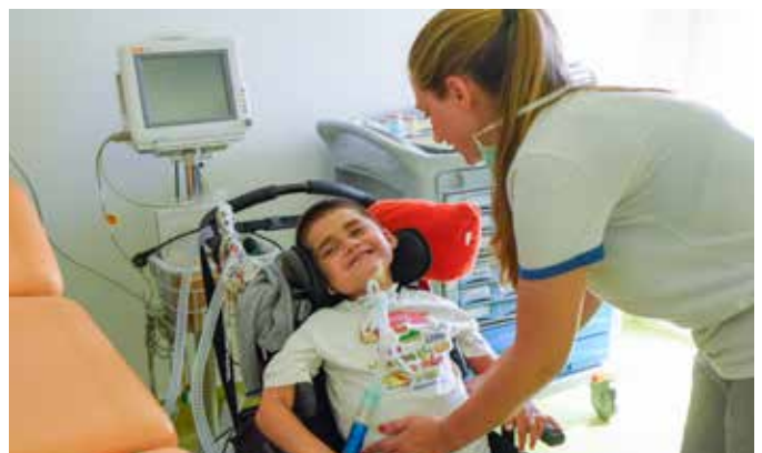
Kastelo est la première unité de soins palliatifs pour enfants dans la péninsule ibérique. Une équipe d'infirmières et de pédiatres y prend en charge jusqu'à trente enfants atteints de maladies chroniques.

En tant que principale composante humaine des soins de santé au niveau mondial, les personnels infirmiers occupent une position stratégique qui leur permet d'influencer la qualité des soins palliatifs prodigués tout au long de la maladie 39 . Les personnels infirmiers jouent un rôle central dans les soins palliatifs car le fondement même de leurs soins – l'orientation holistique et le respect de la dignité de la personne – offre un énorme potentiel inexploité d'apporter aux personnes en fin de vie ce qui compte le plus pour elles. Une analyse systématique de services de soins palliatifs réalisée en 2016 a montré que le rôle des infirmières y était plus apprécié que celui de toute autre discipline 40 . Les infirmières collaborent avec leurs communautés et avec leurs équipes interdisciplinaires pour prodiguer des soins de fin de vie de qualité aux communautés et aux systèmes de santé. Elles donnent ainsi aux malades l'espoir de vivre dans de bonnes conditions le plus longtemps possible, tout en favorisant l'accès universel aux soins palliatifs et l'instauration d'un système de soins florissant, complet et intégré.