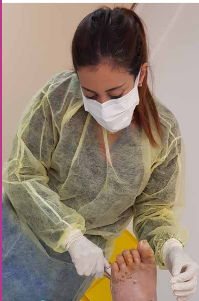
Une infirmière traite une blessure à l'hôpital de Bar Elias, au Liban.

De plus, nous constatons les effets positifs de notre engagement à traiter l'état global des patients et non pas uniquement leur maladie. Au cœur du programme, les infirmières apportent leurs connaissances, leur expertise technique, leur jugement et leurs relations interpersonnelles avec les patients et les familles : telles sont les clefs du succès du traitement des plaies dans notre hôpital.